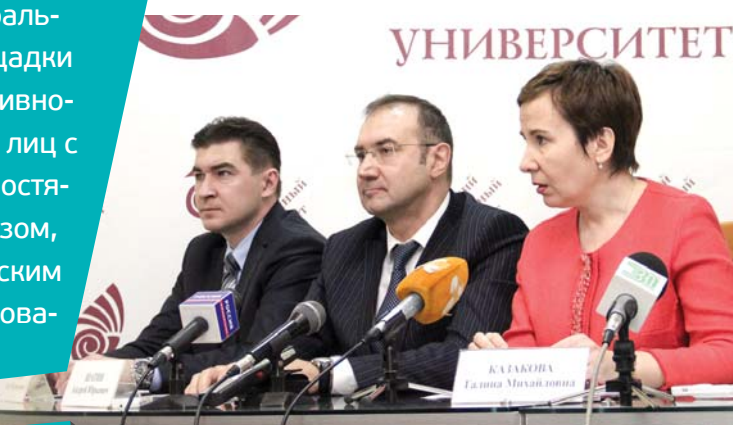
ЧелГУ — первый среди вузов Челябинской области обладатель мегагранта

Ещё одной победой вуза стало получение статуса Федеральной инновационной площадки в рамках проекта инклюзивного обучения инвалидов и лиц с ограниченными возможностями здоровья. Таким образом, ЧелГУ признан методическим центром России по образованию инвалидов.