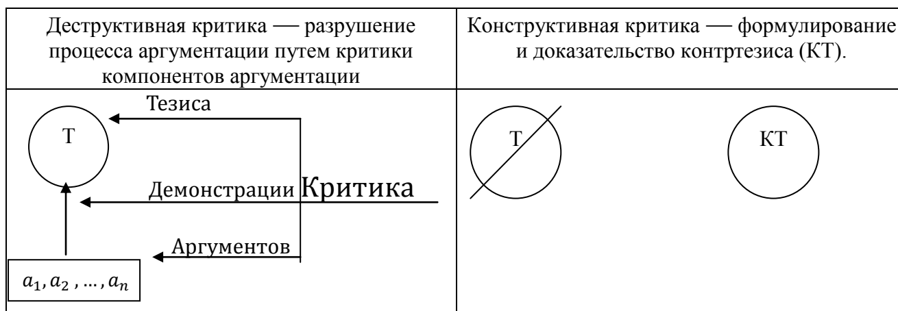
Рис. 2. Виды критики (по В.И. Кириллову и А.А. Старченко [Кириллов 2008]).

Опровержение представляет собой операцию полного установления ложности некоторой пропозиции и является частным случаем критики, которая, в свою очередь, является вероятностным обоснованием ложности. Если продолжить разворачивать эту оппозицию, необходимо различать критику/опровержение аргументации и критику/опровержение тезиса. Критика и опровержение аргументации предполагают анализ и выявление некорректности последней с использованием логических средств или ранее доказанных утверждений. Представим основные способы критики аргументации.