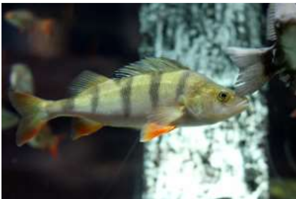
Е) Речной окунь