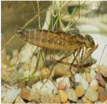
Г) Личинка стрекозы