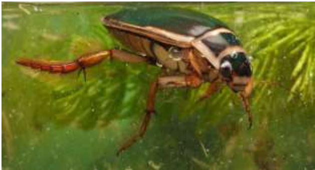
Д) Плавунец окаймленный