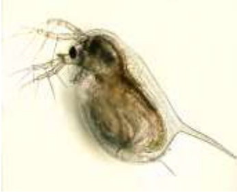
В) Daphnia magna