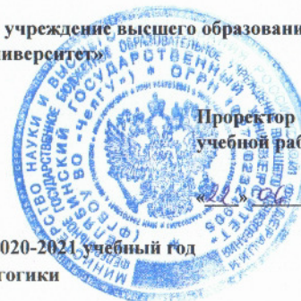
График одобрен Ученым советом ФГБОУ ВО «ЧелГУ» «22» 06 2020 г. протокол №23