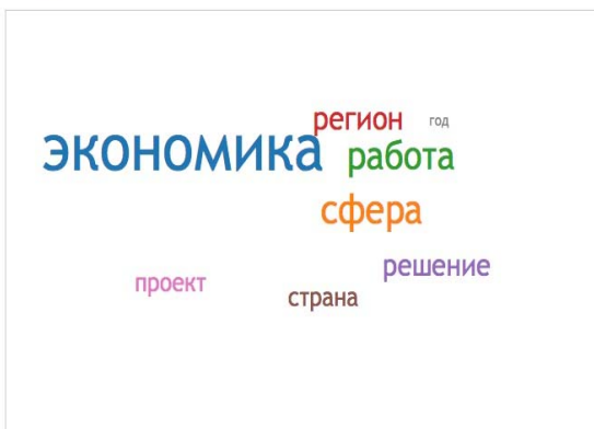
Рис. 1. Смысловое поле слова «Россия»