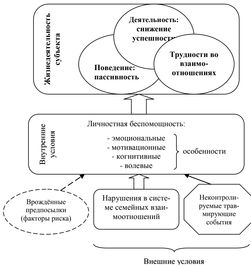
Рис. 2. Графическое отображение основных факторов формирования личностной беспомощности и её проявления в жизнедеятельности субъекта

Можно предположить, что существуют врождённые предпосылки личностной беспомощности, но они не носят решающего характера, являясь факторами риска.