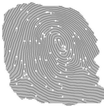
Рисунок 1. Отпечаток пальца

Если наименование рисунка состоит из нескольких строк, то его следует записывать через один межстрочный интервал.