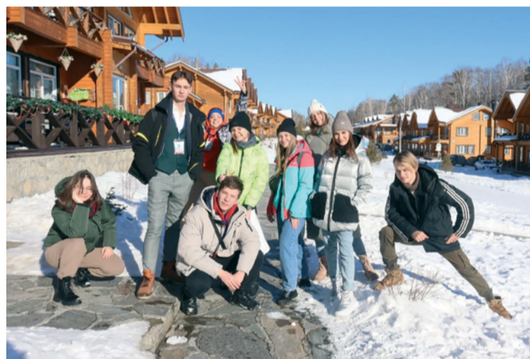
▲ Они противники, но лишь на момент соревнований, а в жизни мы единое целое.