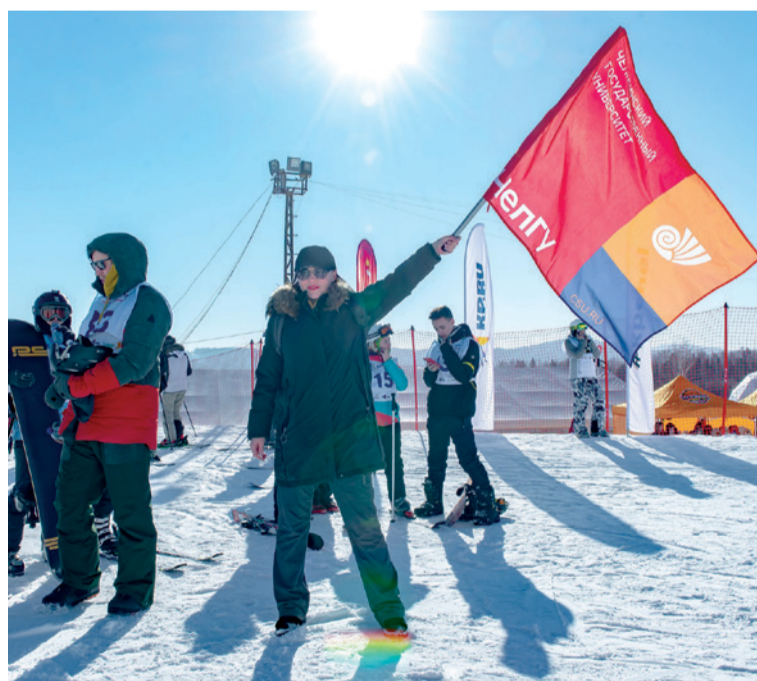
▲ Заветный флаг, как маяк, манит к себе больше, чем надпись «Финиш».

песни, которую наша команда хотела исполнить на визитке, «Мы» группы «Дайте танк (!)». Еду и под нос напеваю слова песни: «... впечатления – наша валюта, мы сказочно богаты, сказочно богаты, сказочно богаты – ты и я». Вот последний флажок –