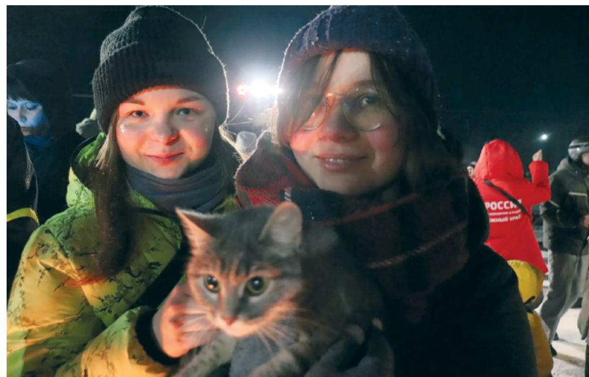
▲ Пушистая продрогшая находка оказалась очень ласковой и спокойной кошкой.

так отчаянно хотели исполнить, нам не приходится.