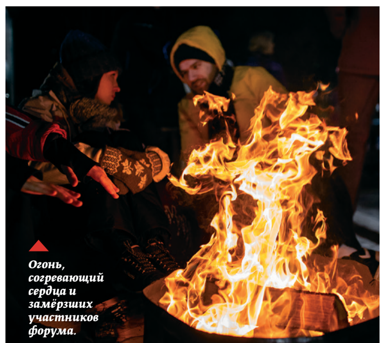
▲ Огонь, согревающий сердца и замёрзших участников форума.