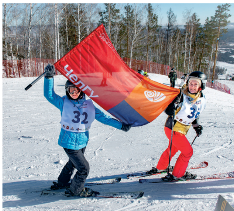
▲ Силы появляются благодаря поддержке.

и финиш. Дожидаюсь свою команду у подножия горы и предлагаю ещё покататься, пока есть время на счётчике. Ребята одобрительно кивают, и мы отправляемся на вершину горы. Наслаждаясь солнечным днём и возможностью от форума покататься после соревнования, осознаю, что песня, которую мы должны были петь, не зря стала саундтреком этой поездки. «... впечатления – наша валюта, мы сказочно богаты, сказочно богаты...», – пока мы студенты и у нас ещё нет ни работы, ни денег, у нас есть другая ценность – впечатления, эмоции, – вот наша валюта. Чем больше впечатлений за спиной, тем богаче ты внутренне. Пока весь мир соткан из материи и денег, мы состоим из глубины душ, эмоциональных откликов