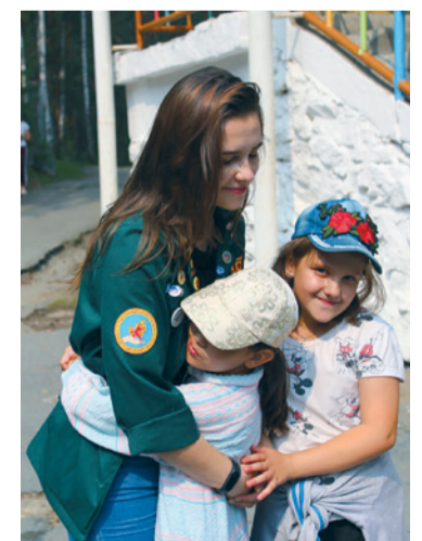
Полосу подготовила Ульяна РОМАНОВА , фото из архива Штаба студенческих отрядов ЧелГУ

сий и организаций для обучения студентов Челябинской области. В начале марта будут известны результаты последнего конкурса. Челябинский госуниверситет подал заявку на подготовку 400 специалистов, среди которых вожатые, официанты и горничные. Учебную нагрузку разделяют преподаватели факультетов и комбината студенческого питания ЧелГУ, а также сотрудники отеля «Парк-Сити».