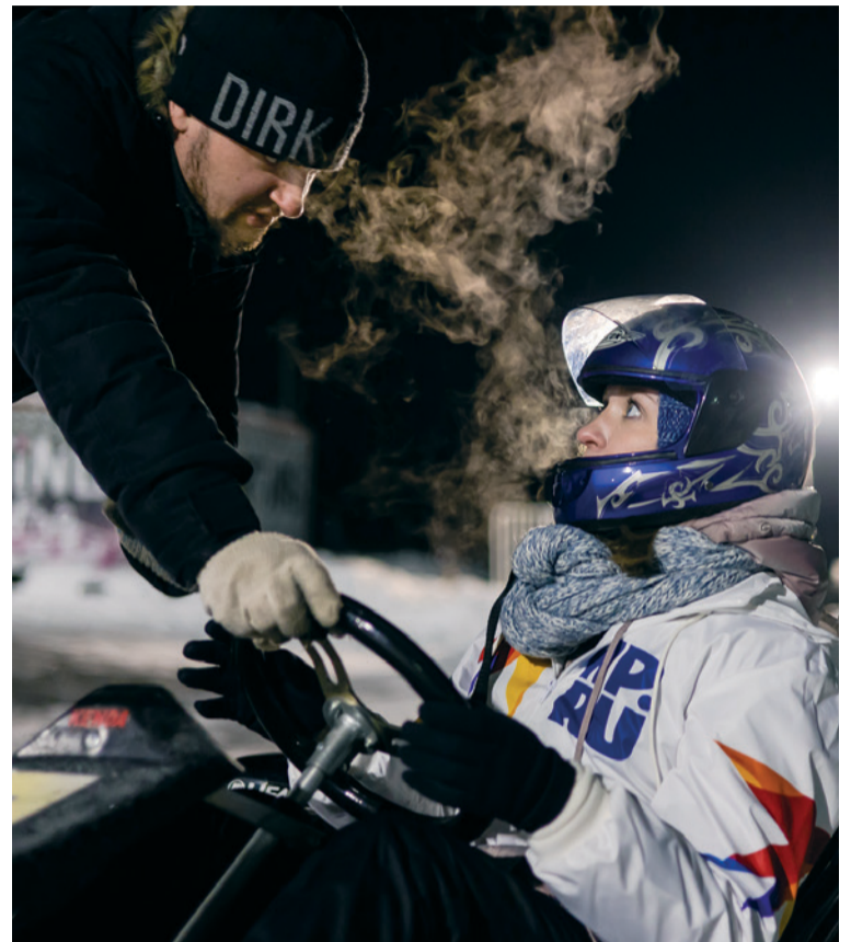
▲ Гонщики не гонят, они гоняют и не загоняются.

В соревнованиях нет ценза 18+, и я очень рада, что оргкомитет поддержал идею о внесении в списки участников студентов, и мы все сегодня здесь.