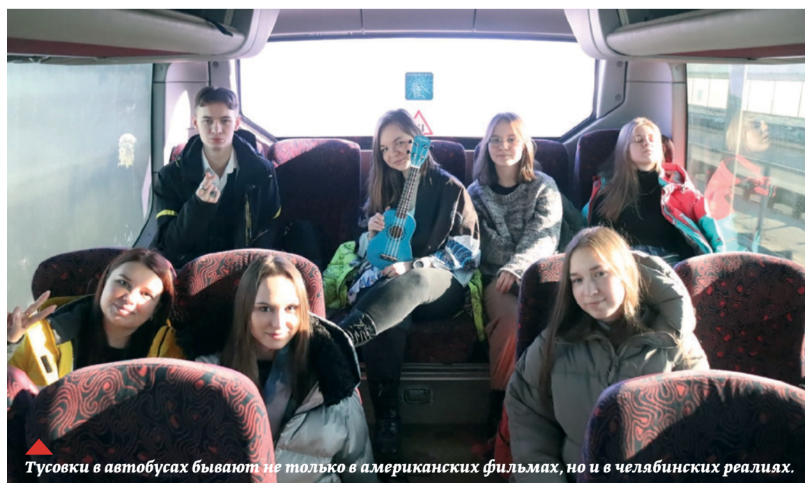
▲ Тусовки в автобусах бывают не только в американских фильмах, но и в челябинских реалиях.