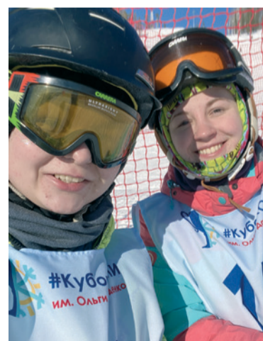
▲ «Вершину» покорили и селфи сделать не забыли!