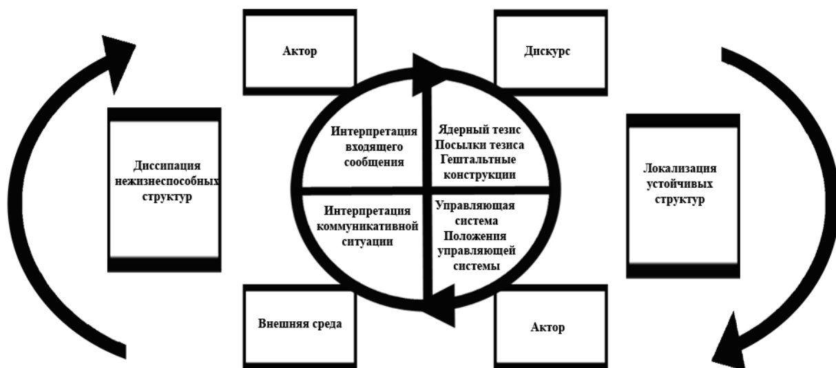
Рисунок 3.1 – Синергетическая модель коммуникации

Таким образом, в графическом виде мы можем представить синергетическую коммуникативную модель следующим образом (см. Рисунок 3.1).