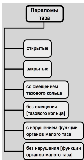
Рис. 1. Граф ответа 602-511/5-Э

Представим этот ответ в виде графа, репрезентирующего только сами термины (рис. 1):