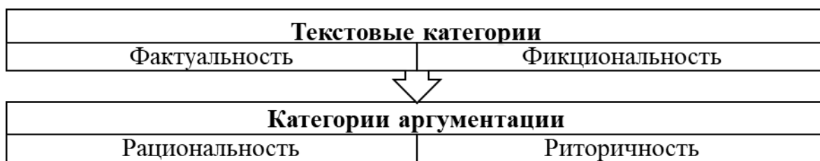
Рисунок 2 – Соотношение текстовых категорий и категорий аргументации

В разделе 2.2.1 производится сопоставление категорий фактуальности и фикциональности оппозитивного экологического медиадискурса. Приведены данные текстового подхода и сведения из области жанроведения, согласно которым в анализ необходимо включать критерий различия между фактуальным и художественным текстом. Это связано с минимальным стремлением авторов к объективности, что является имманентной чертой некоторых жанров. Эти рассуждения дополнены доводами из области дискурсологии, согласно которым распределение фактуальной информации управляется самим дискурсом. Кроме того, вносятся некоторые уточнения с точки зрения логического изучения факта. В ходе обобщений указывается, что в медиадискурсе, задействующем экологическую тематику, есть возможность наблюдать и анализировать как диктум, так и модус сообщений, где диктум представляет собой факт описания, а модус — возможные интерпретации (в терминах Н. А. Пром — «медийная фактуализация»), которые включают искажение событий и фактов. Различия между этими категориями описаны в терминах теории аргументации с позиции рациональности и риторичности (см. Рисунок 2).