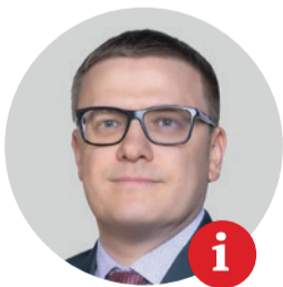
Алексей Текслер, губернатор Челябинской области

На Южном Урале идеи евразийства находят особый отклик и понимание. Многие столетия назад через наш регион проходил шёлковый путь, позже через Челябинск пролегла Транссибирская магистраль, связав в широком смысле Европу и Азию. Налаживались торговые, деловые связи, культурное взаимодействие, взаимное доверие. Этот многовековой опыт сотрудничества очень важен сейчас, когда сохраняется противостояние государств и политических блоков и всё чаще «водораздел» проходит между Востоком и Западом. В основе евразийской идеи всегда было признание самобытности каждого народа, уважение к традициям, стремление к культурному обмену и взаимовыгодному торговому и деловому сотрудничеству. Сегодня Челябинская область сотрудничает более чем со 120 странами мира, и мы уверены в том, что наши компании справятся с возникающими изменениями. Но экономика – это лишь одна из граней многостороннего сотрудничества. Поэтому я оцениваю проведение форума как знаковое событие для нашей области. Сегодня актуально говорить о евразийском сотрудничестве: важно налаживать связи, создавать проекты, расширять взаимодействие в науке, культуре, образовании.