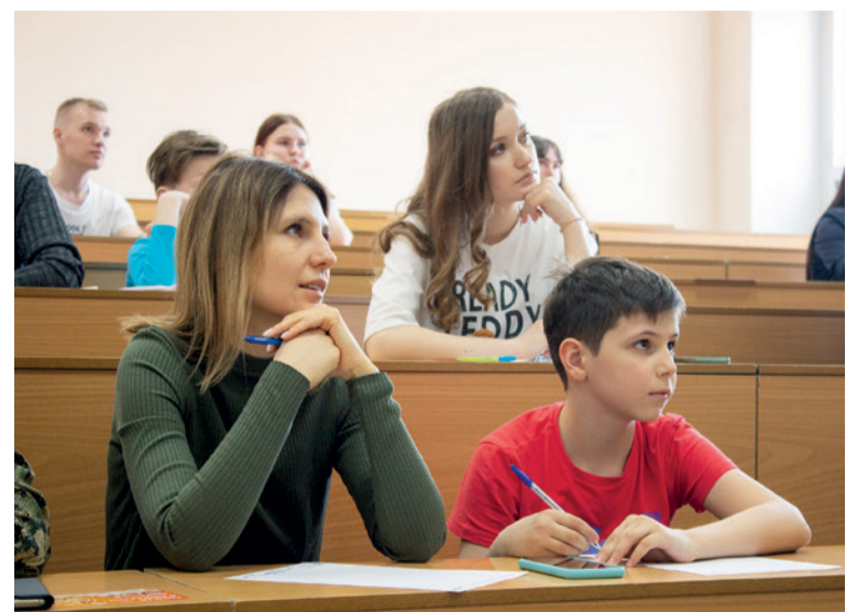
▲ В «Тотальном диктанте» принимают участие не только студенты. На акцию приходят целыми семьями проверить свою грамотность – как взрослые, так и дети.

Автор материала Анастасия МАКРАУСОВА