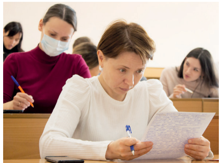
▲ Финальный этап диктанта – внимательно проверить текст, который сдаётся на проверку.