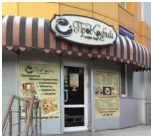
Рисунок 1. Магазин «ПроКофий».

Рассмотрим, насколько понятны русским и китайским студентам три эргонима: кофейня «ПроКофий», магазин «ЁПРСТ» и суши-маркет «Пару палок».