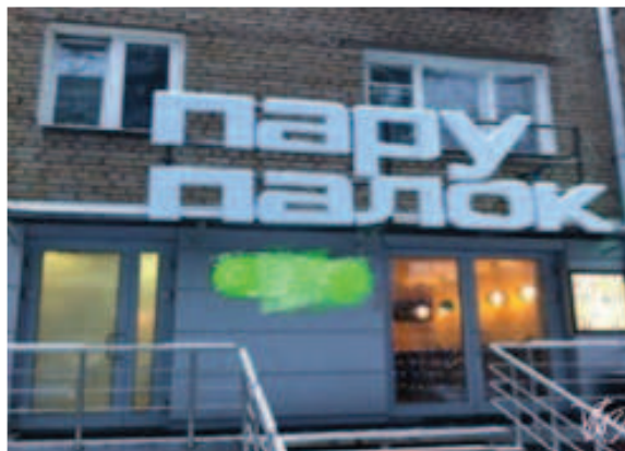
Рисунок 3. Суши-маркет «Пару палок».

На втором этапе после просмотра фотографии магазина количество ответов «не знаю» сократилось (21 ответов из 100), рекламная подпись под основной вывеской (суши-маркет) внесла ясность в понимание предлагаемого ассортимента и привела к преобладанию ассоциаций с блюдом суши: 日本料理 (японская кухня) (20), 寿司店 (суши) (11), 用筷子吃寿司所以是 (продает суши, потому что есть суши надо с использованием палочек, поэтому пару палок) (9), 给人留下印象 (производить впечатление) (4), 卖寿司 (продает суши) (4), 一双筷子, 用筷子吃饭·特色 (палочки, ешьте палочками, это характеристика) (4), 简约 (минимализм) (3), 快餐店 (ресторан быстрого питания) (3), 说明寿司很好吃 (значит, что суши вкусные) (3), 围脖 (шарф) (3), 中餐厅用中国元素的东西比较能吸引客人 (китайские рестораны используют китайские элементы для привлечения клиентов) (3), 棒球店 (бейсбольный магазин) (2), 比较醒目 (более заметный) (2), 化妆品 (магазин косметики), 卖吃的 (продает продукты), 卖灯的 (продает лампы), 面条需要用筷子吃 (чтобы есть лап-