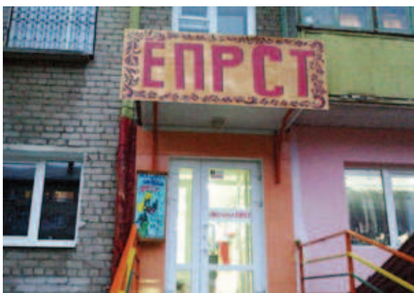
Рисунок 2. Магазин «ЕПРСТ»

Таким образом, можно сделать вывод о том, что практически все студенты поняли значение этого названия. Отличие в восприятии у русских и китайских студентов можно увидеть в том, что русские связывают это название с именем Прокофий и фамилией Прокофьев, что неизвестно китайским студентам. Китайские же студенты часто выделяют корень и соотносят его со словом кофе. Можно отметить и еще одну стратегию, которая не встречается у русских студентов, — оценивание. Например: «ПроКофий» — 好看 (хорошо выгля-