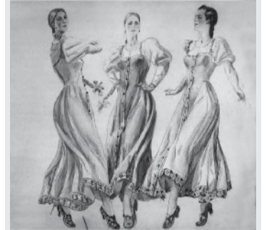
▲ Эскиз А. Дейнеки

Это был не лучший период в жизни художника, от него потребовалась недюжинная выдержка, стойкость характера и ясность собственной позиции. Дейнека проявил волю, и росписи, несмотря на столь массивный натиск, остались в оригинальном варианте.