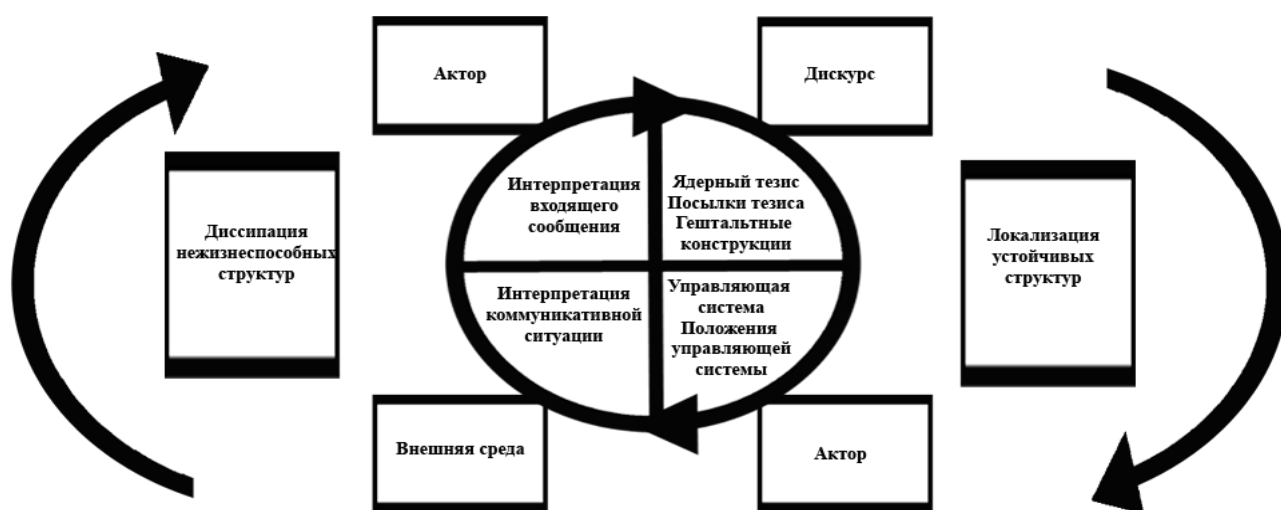
Рисунок 1 – Синергетическая модель коммуникации

В разделе приводится графическая схема синергетической модели коммуникации (Рисунок 1).