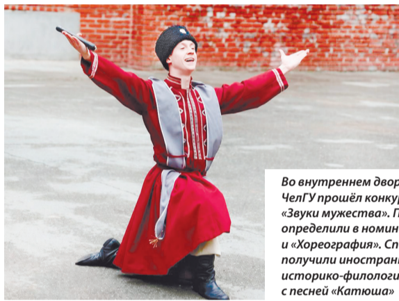
Во внутреннем дворе первого корпуса ЧелГУ прошёл конкурс военной песни «Звуки мужества». Победителей определили в номинациях «Вокал» и «Хореография». Специальный приз получили иностранные студенты историко-филологического факультета с песней «Катюша»