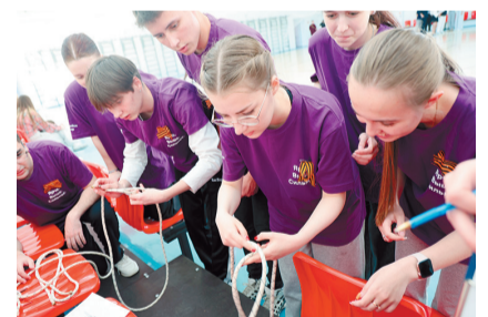
В рамках проекта «Кубок ректора» в ФОКе прошла военно-спортивная игра «Зарница». Мероприятие организовало «Движение первых» ЧелГУ