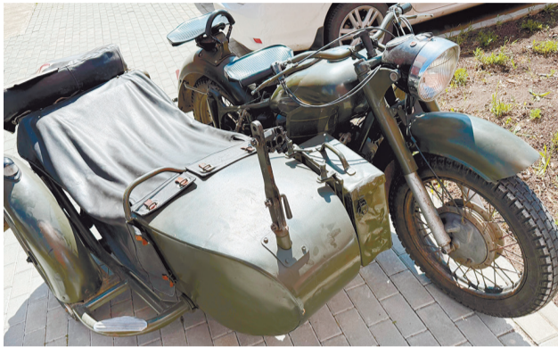
Возле физкультурно-оздоровительного комплекса развернулась военная выставка. Вооружение и технику предоставили ВПК «Танкоград» и общественная организация «Русская дружина»

Ко Дню Победы в нашем вузе были приурочены разноформатные мероприятия: студенты соревновались на «Зарнице», пели и танцевали на конкурсе «Звуки мужества», писали «Диктант Победы», посещали выставку и праздничный концерт.