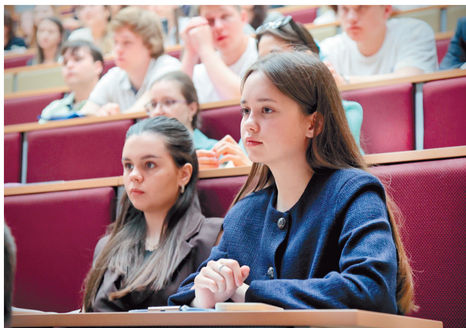
Три дня продолжалась Всероссийская конференция, посвящённая 35-летию института права. В первый день работала секция «Частное право», во второй — «Историко-теоретические и публично-правовые науки», в третий — «Уголовно-правовая защита частных и публично-правовых интересов». Ведущие эксперты и перспективные исследователи сошлись в дискуссиях и обменялись опытом.