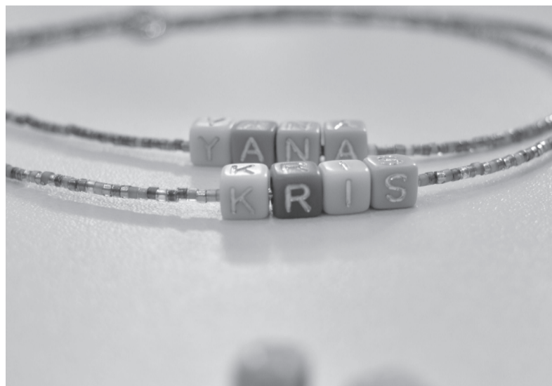
Стильные чокеры ручной работы.

У кращения из бисера – это база, которая уже долгое время не выходит из моды. Но кому-то может показаться, что это только детское украшение, а не стильная бижутерия. Эти сомнения мы решили развеять вместе с руководителем оптового направления Peach (бренда авторских украшений) Светланой и мастером Полиной.