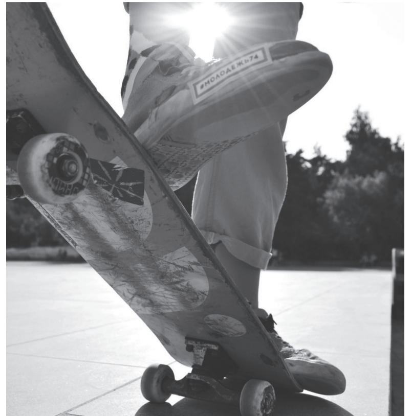
Тусовка молодых скейтеров Челябинска.