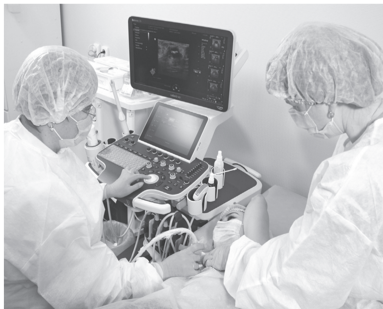
В онкоцентре идет обследование.