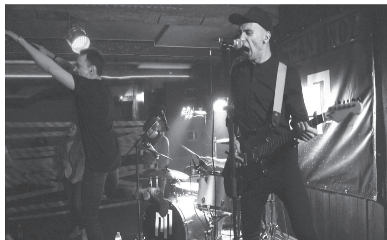
Выступление группы «Перезвоните позже» в Челябинском клубе.