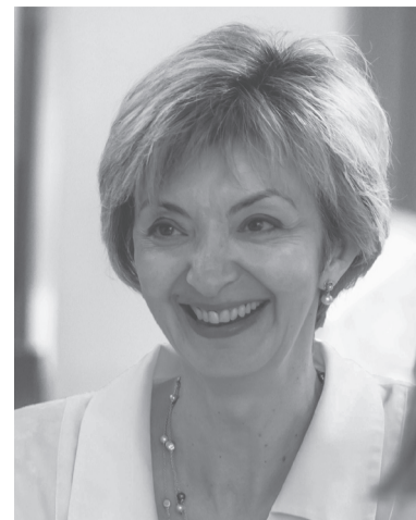
Лия Захарова.

Но в какой-то момент убедил, возникло видение, как это сделать. В итоге дописано то, чего не хватало, и получилась книга в четырех частях. После издания от тиража