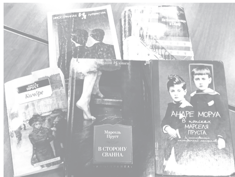
Любимые книги Ирины Михайловны.