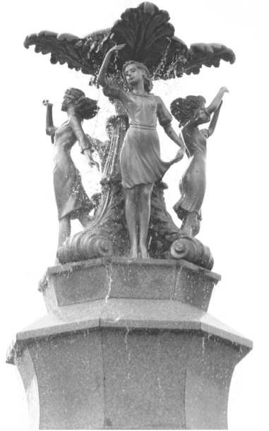
Фрагмент фонтана «Танцующие грации» у Оперного театра.

Это гигантская задача с очень хорошим потенциалом. Тогда можно было бы очень расширить границы представления о городе и нащупать скрепы, которые должны быть. Это помогло бы выявить тренд в представлениях горожан и запросе на реализацию этого кода.