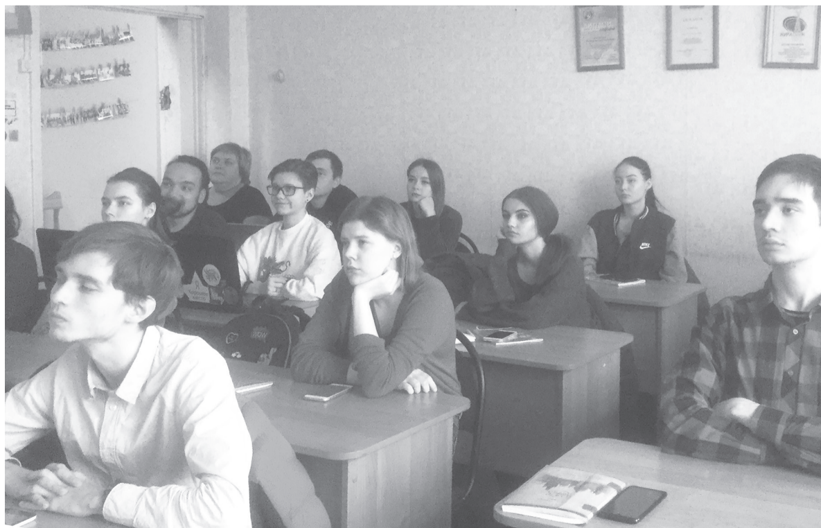
Студенты на лекции Ирины Михайловны Удлер.