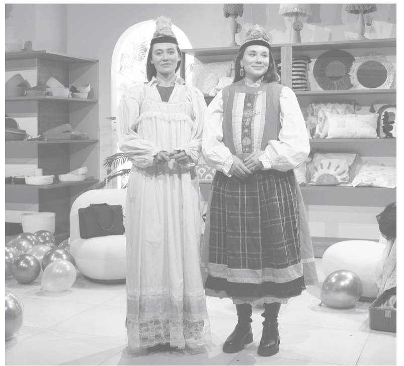
Модели в национальных костюмах.

Розовый цвет был связан с модной революцией 30-х годов.