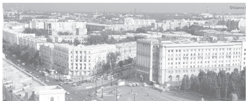
Челябинск, вид на площадь Революции, 2010 г.

Челябинск как город – это не просто здания, сооружения и программы развития – это еще и люди. И чем больше будет пространств для творчества и выражения, тем ярче и интереснее будет образ.