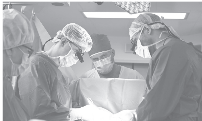
Идет операция.

– Хожу, сплю, пытаюсь смотреть видеоролики, сериалы.